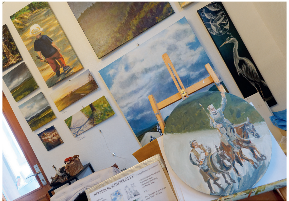
Arbeiten in der Küche