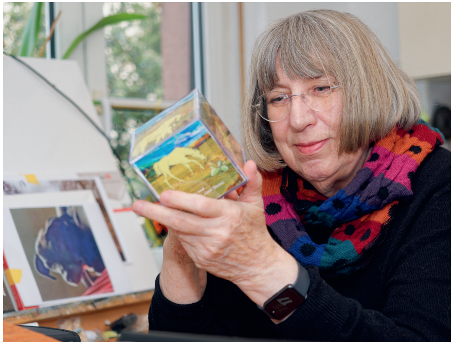
Oben: Ein Bilderwürfel für Kinder, bei dem die Bilder ausgetauscht werden können.

Eine weitere nette Geschichte dreht sich um „Fritzi“! Fritzi ist ein bei einem Waldspaziergang mit der Familie zugelaufenes, völlig entkräftetes Wildschweinerkel. Es wurde auf dem Bauernhof ihrer